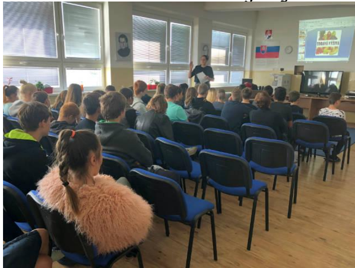
Prednáška o zdravej výžive